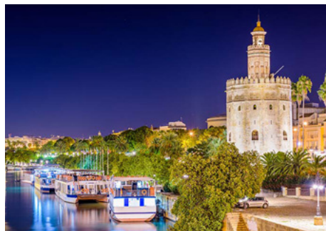
Torre del Oro, España