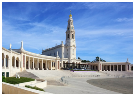
Santuario de Fátima

Lunes, 16 de Sep: Traslado para el aeropuerto de San Francisco, formalidades de embarque y viaje hasta Roma. Vuelo durante la noche.