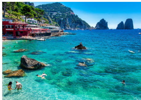
Isla de Capri, Italia