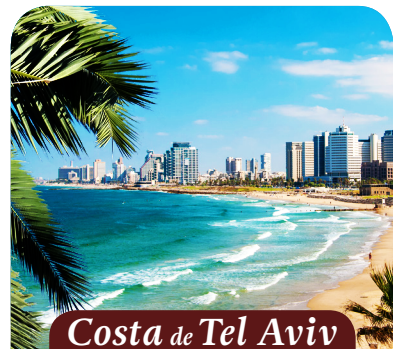
Costa de Tel Aviv

1 de Abril: Abordaremos el vuelo de regreso a casa, no sin antes atesorar en nuestra memoria recuerdos inolvidables de caminar por las "Páginas de la Biblia."