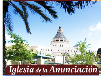
Iglesia de la Anunciación