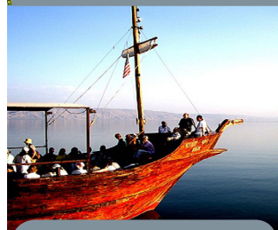
Mar De Galilea