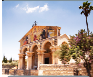
Iglesia de la Agonía