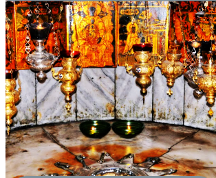
Basilica de la Natividad