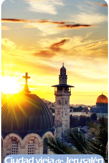
Ciudad vieja de Jerusalén

Martes, 29 de Agosto: Vuelo de Roma a San Francisco y Seattle, no sin antes atesorar en nuestra memoria recuerdos inolvidables al caminar por tierras bíblicas.